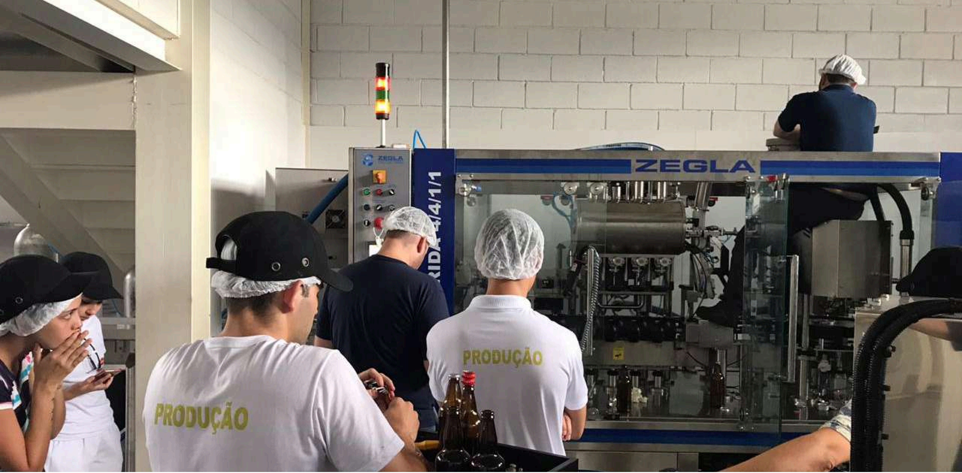
START DE NOVA LINHA DE ENVASE NA CERVEJARIA CHOPP BRASÍLIA , GAMA - DF