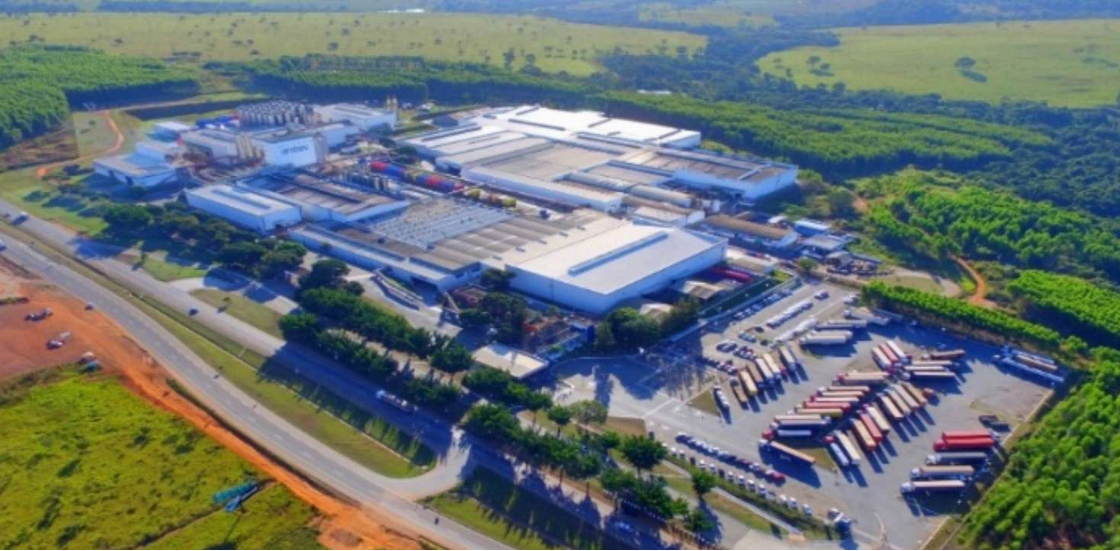
AMBEV UNIDADE CEBRASA - ANÁPOLIS, GO