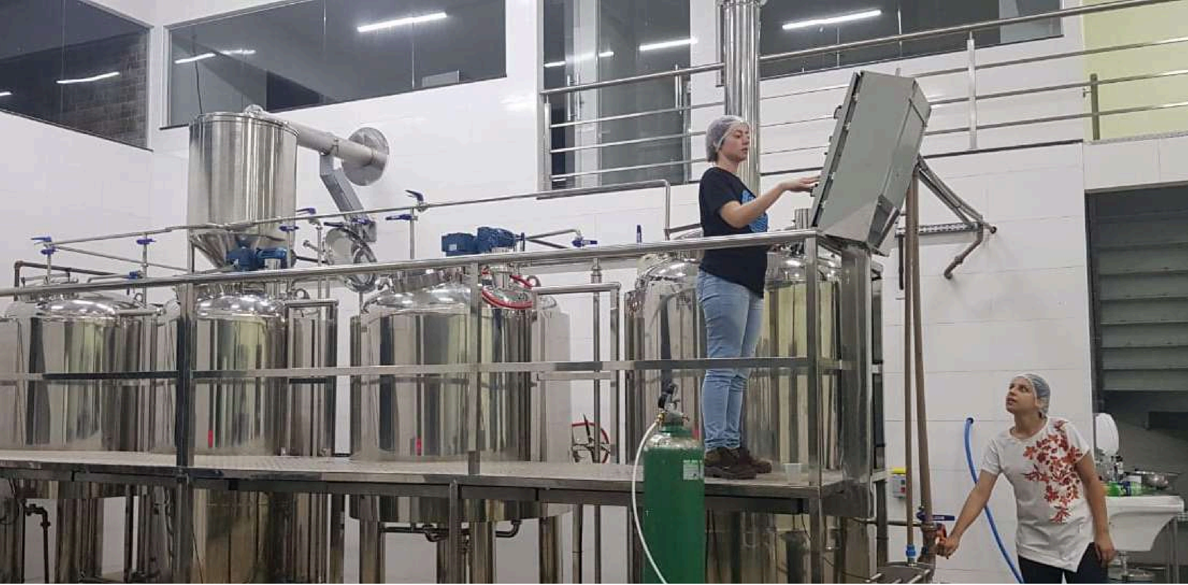
START DE MAQUINÁRIO NA GONT'S CERVEJARIA, BRAZLÂNDIA - DF