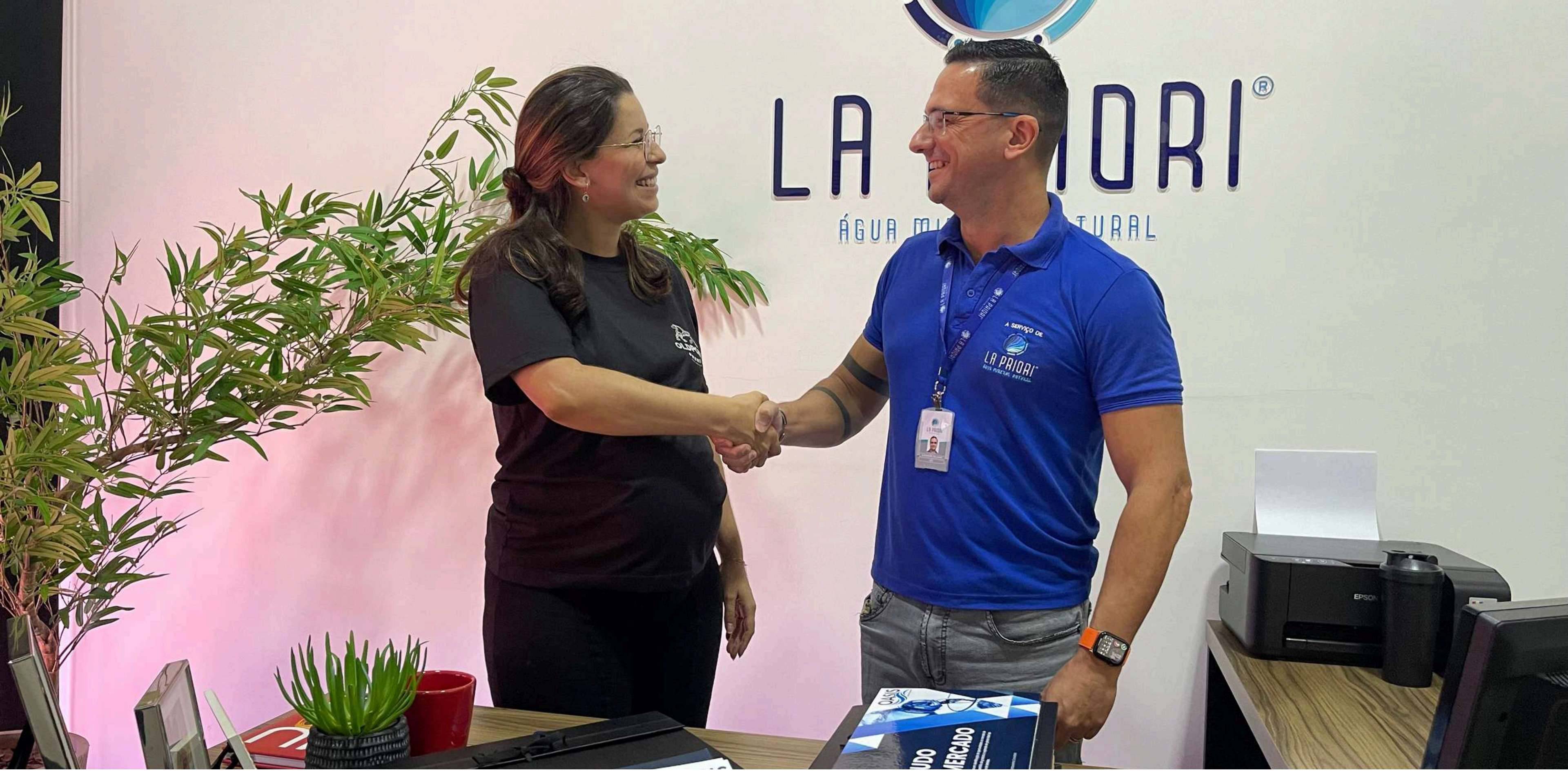
ENTREGA DE PROJETO DE EXPANSÃO DA OASIS COMPANHIA DE BEBIDAS - BRASÍLIA, DF