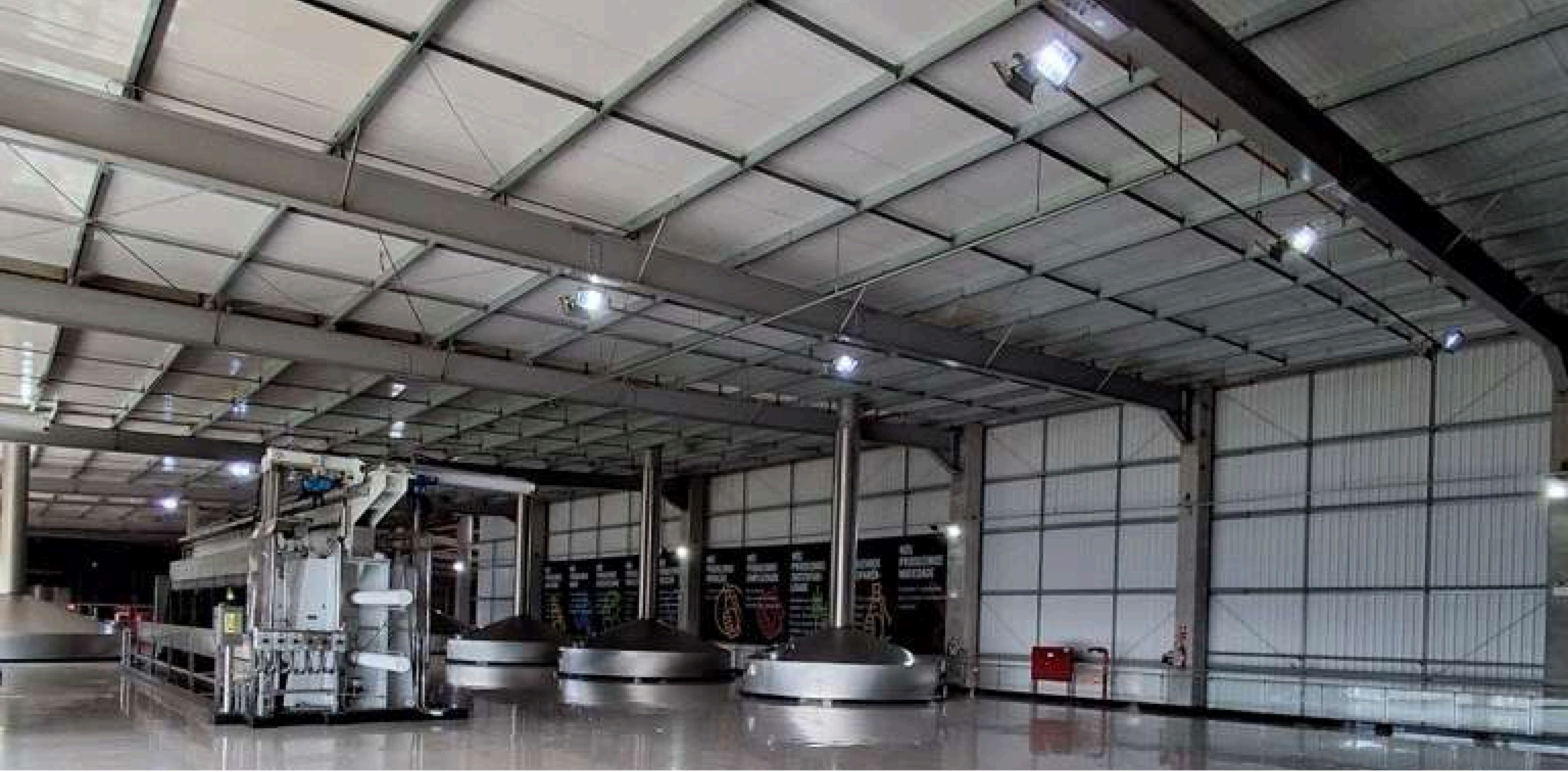
AMBEV UNIDADE ADRIÁTICA - PONTA GROSSA, PR