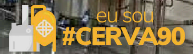
CERVEJARIA GRÃÃOS EM FASE DE REGISTRO NO MAPA - CRAVINHOS, SP - RESULTADO DE PROGRAMA DE MENTORIA CERVA90, ÁQUILIS B&A