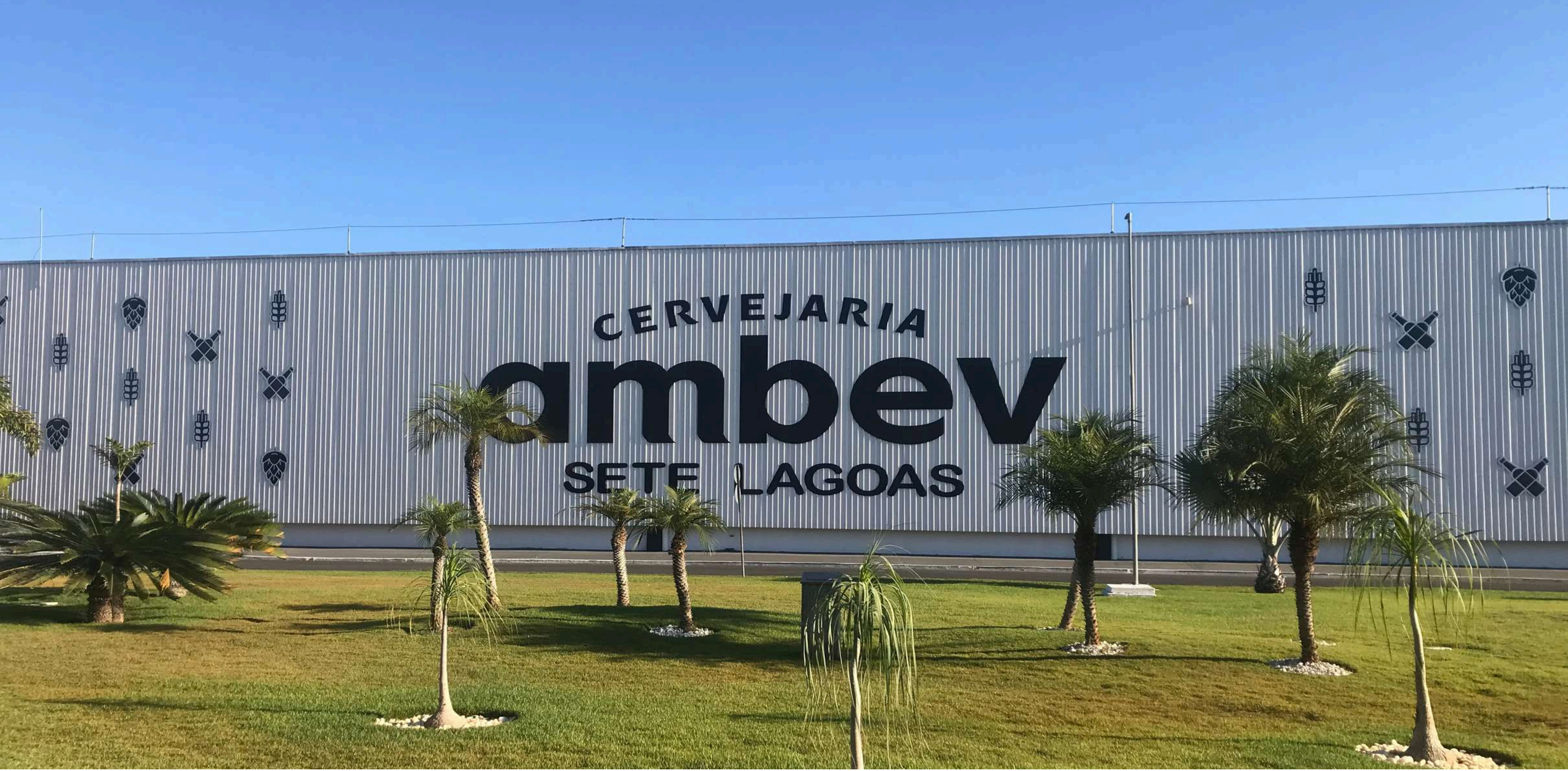
AMBEV UNIDADE NOVA MINAS - SETE LAGOAS, MG